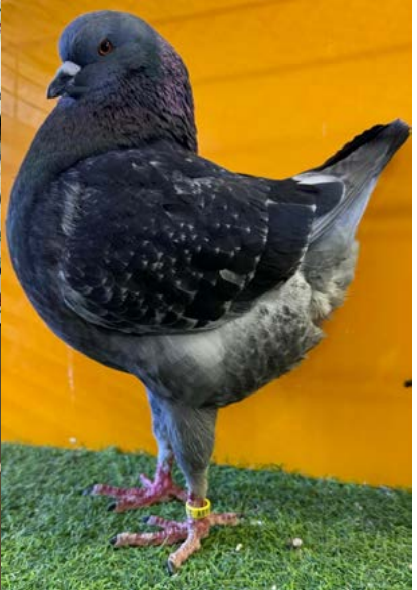
The Fancy Pigeon