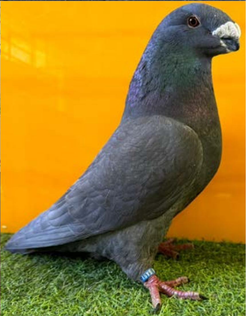
The Fancy Pigeon