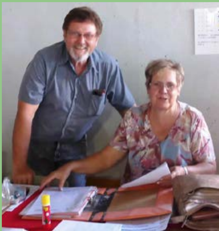
dit netjies is!!!!